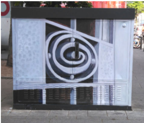
Karlstrasse/Ecke Hermann Steinhäuser

Auftraggeber ist die Bürgerinitiative Östliche Innenstadt, Förderer "Besser Leben in Offenbach" GBO