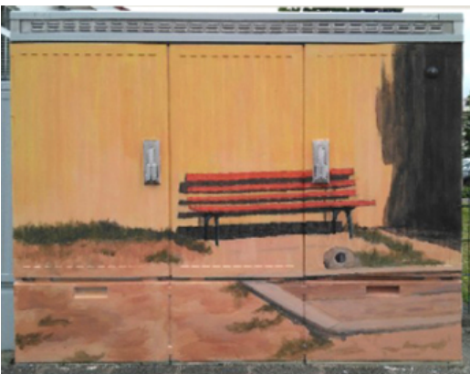
Arthur Zitscher Strasse