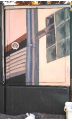
Herrmann Steinhäuser Höhe Mainpark