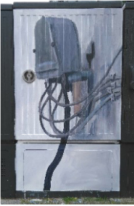
Friedhof Ecke Mathildenstrasse